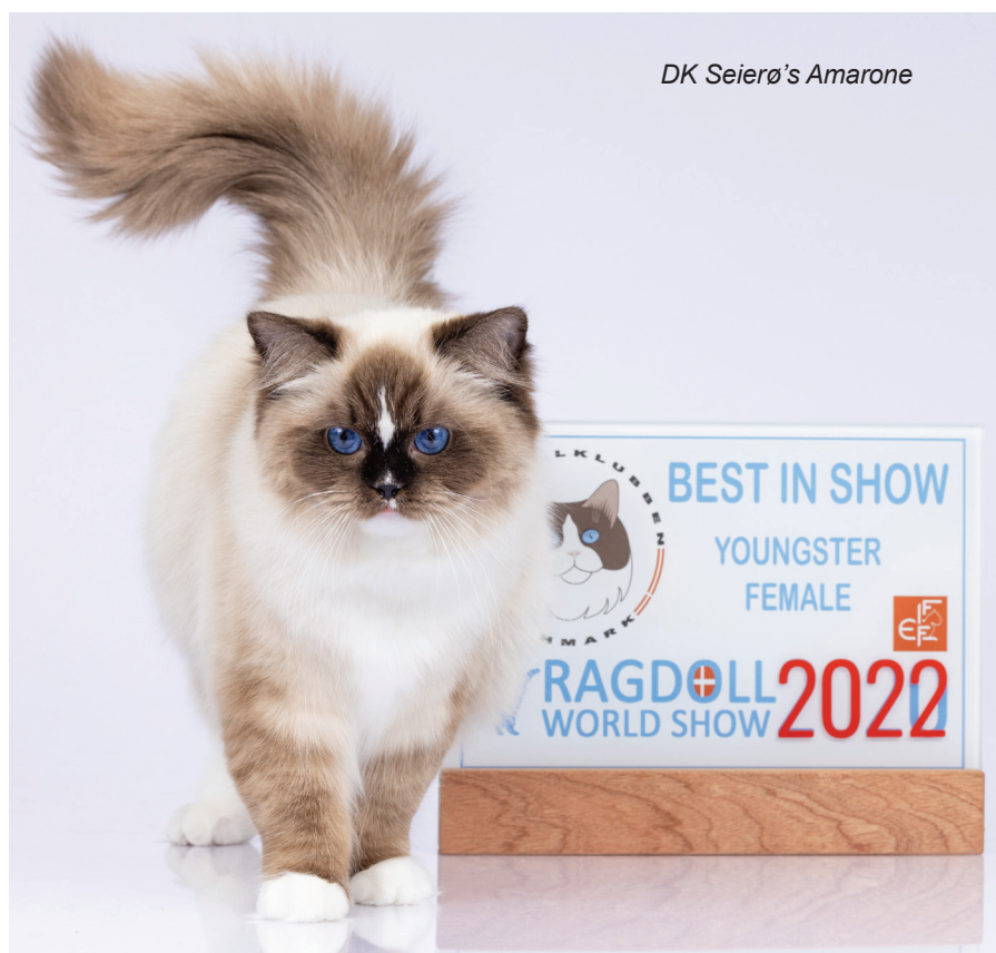
DK Seierø's Amarone

De danske udstillere klarede sig superflot i den skrappe konkurrence.